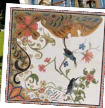
Fernöstlich inspirierte Decken- malerei: zwei Kolibris inmitten zarter Blumenranken.