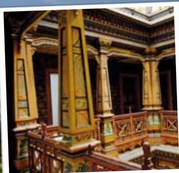
Galerie im Obergeschoss: kunstvoll mit asiatischen Motiven bemalte Säulen.